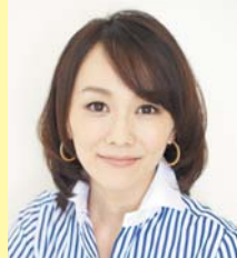
フリーアナウンサー 木佐 彩子