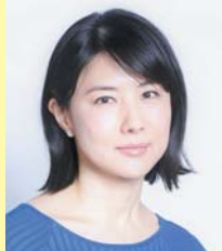
女優・作家・歌手 中江 有里