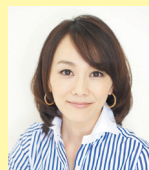
フリーアナウンサー 木佐 彩子