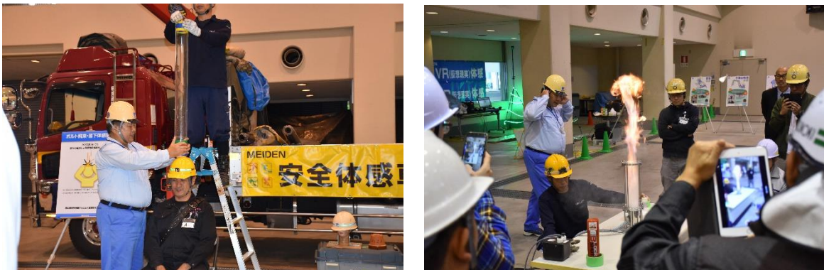
VR 体験以外の安全体感（ボルト落下、粉塵爆発）