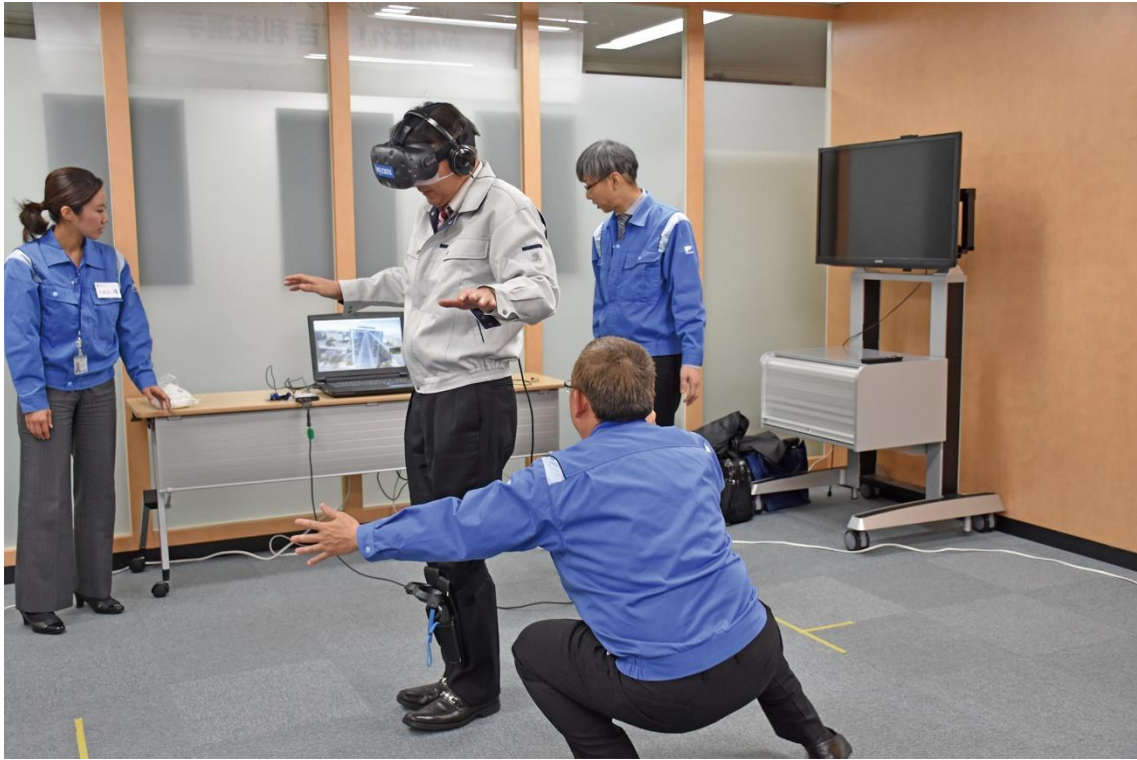
VR の技術で高所からの落下を疑似体験（落下時の転倒に備えに体を支えるスタッフ）